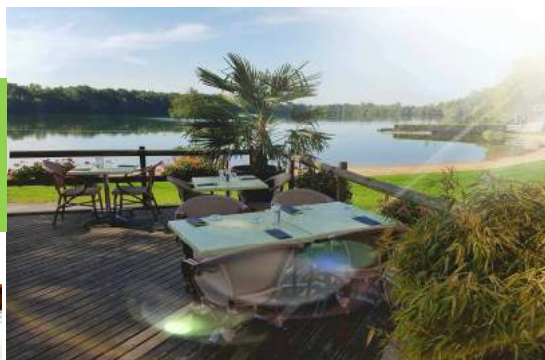
Terrasse au bord des lacs et de la base nautique

Spécialités : grenouilles, jambon persillé, œufs en meurette, escargots, friture